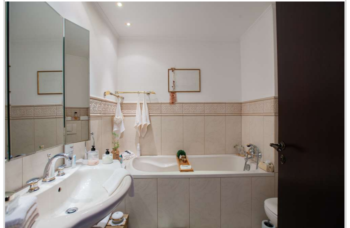
Badezimmer m. Wanne u. Dusche