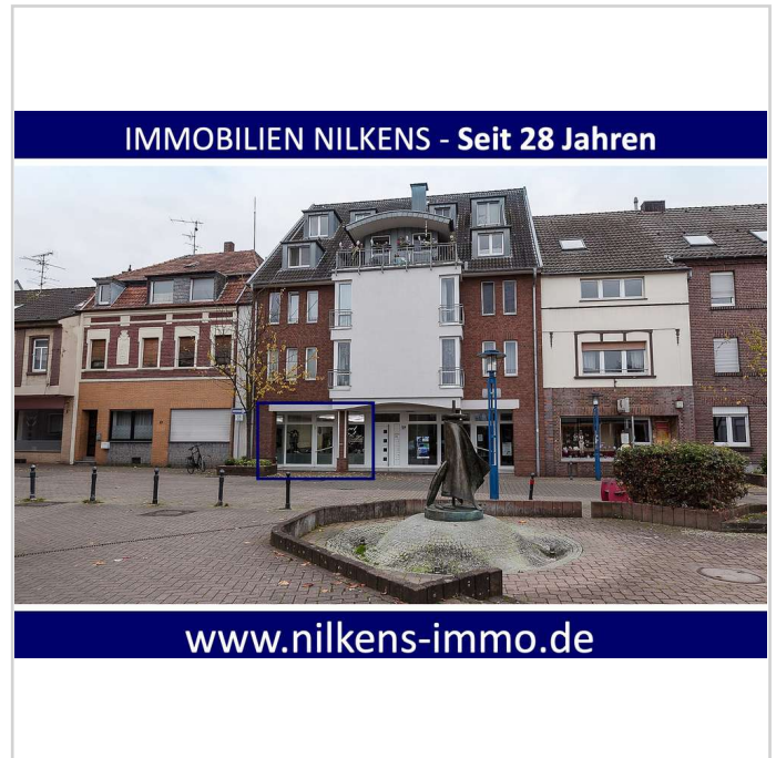
Vorderansicht (EG links)

Innenbesichtigung des angebotenen Objektes bitte nur nach vorheriger Anmeldung und Terminvereinbarung über unser Büro. Unser Angebot wurde nach bestem Wissen, aufgrund der Auftraggeberangaben erstellt. Dennoch können für die Richtigkeit weder Gewähr noch Haftung übernommen werden.