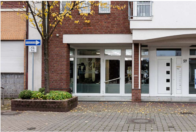
Gewerbereinheit (EG links)

Miet-/Kaufobjekt: Kauf Verkaufsfläche: 61,13 m² Gesamtfläche: 75,82 m² Kaufpreis: 209.000,00 EUR