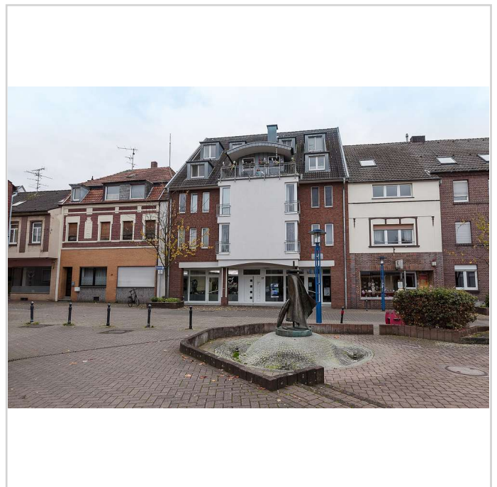
Vorderansicht (EG links)